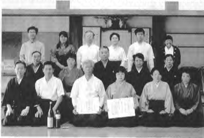
筆者 前列右から二人目