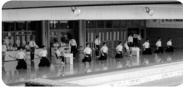
第2日 近的競技始まる