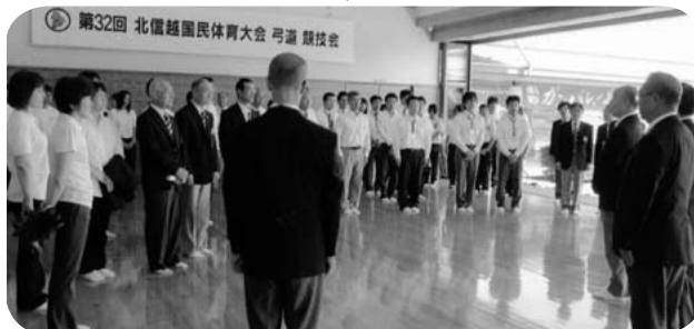
片付けあとのお礼の挨拶