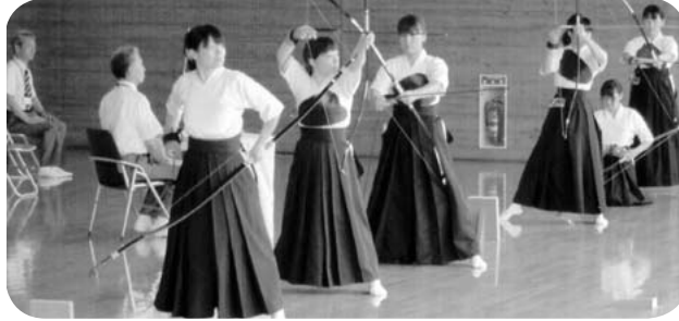
本県成年女子チーム