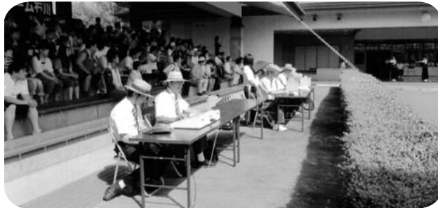
炎天下の的前審判