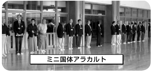
ミニ国体アラカルト