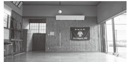
舞台になった長野高校です

が参拝者用のノートにメッセージを残し、インターネットでも巡礼情報が飛び交っている。製作を支援したながのフィルムコミッション関係者は「アニメ(人気)は即効性だけでなく後も引く」と影響力の拡大を期待する。放送はひとまず終わったが、原作の小説は続きがある。アニメの続編製作を含め、今後もツルネが弓道普及で役割を果たすことを願いたい。