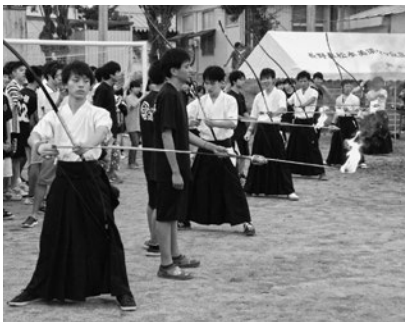
昨年度の文化祭のファイヤーストームへの点火時の火矢の場面です

失敗も自分をより強くする糧になると考え、持ち前の明るさで、次の機会の行動に生かし、射にも活かせるようにし、これからも少しでも美須ヶ丘弓道部の目標である「全国大会出場」に近づけるように日々努力していきたいと思っています。